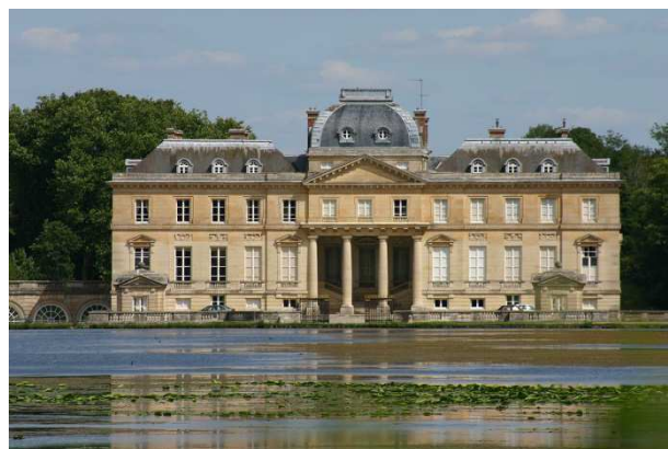
Château du Marais

- 10h00 visite du château de Dourdan (sur inscription maxi 35 personnes)