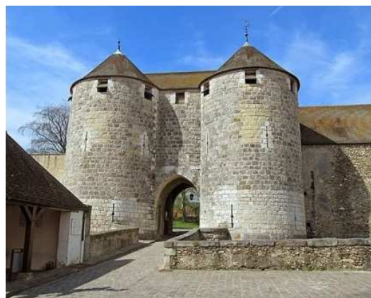
Porte du Château de Dourdan

Samedi soir : repas avec l'ensemble des participants. (coût 17 € / personne) Apéritif et boissons offertes par le Comité Régional Règlement par chèque à l'ordre du CoReg IDF