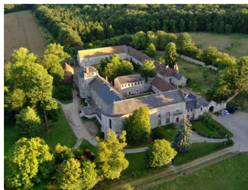
Abbaye de l'Ouÿe